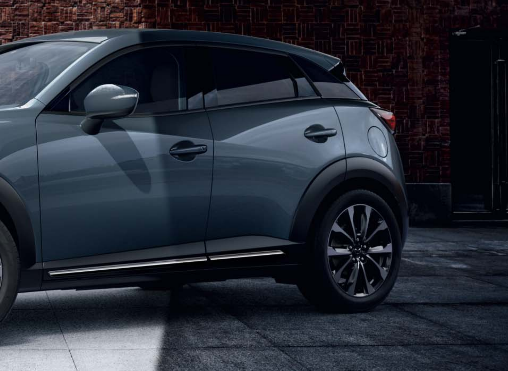
Foto: Mazda CX-3 als Luxury uitvoering in Polymetal Gray Metallic