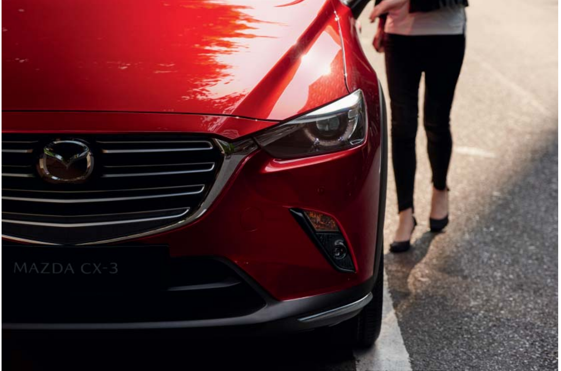
Foto: Mazda CX-3 als Signature uitvoering in Soul Red Crystal Metallic