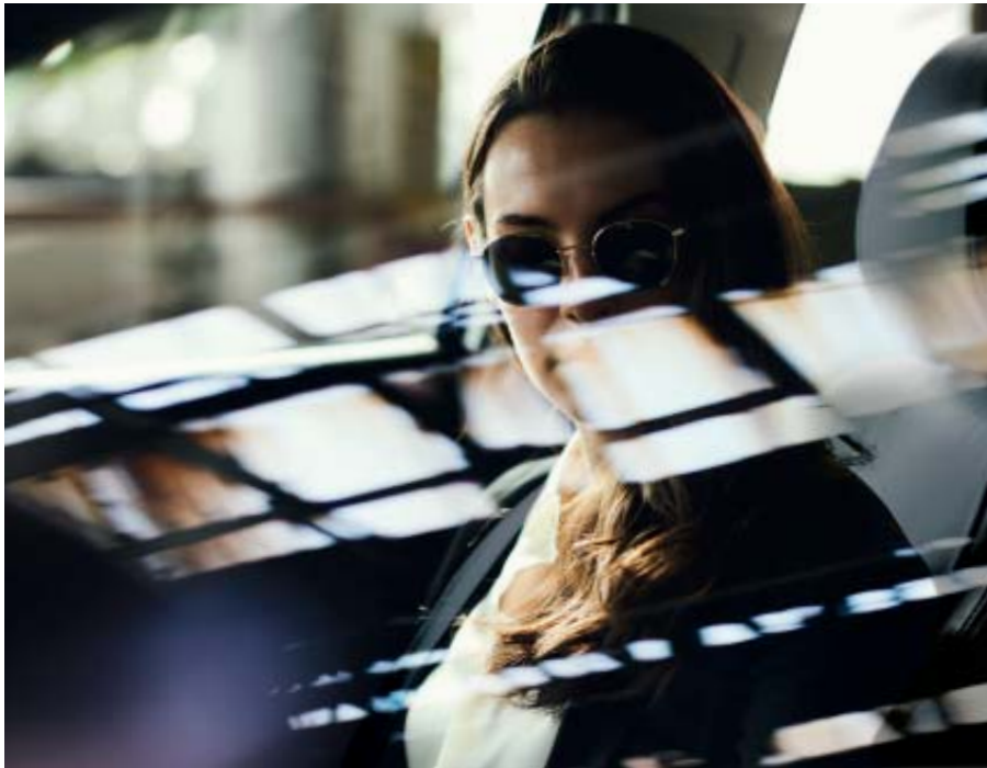
Foto: Mazda CX-3 als Signature uitvoering in Soul Red Crystal Metallic