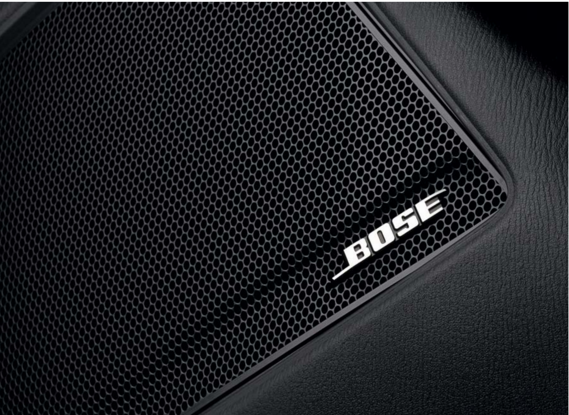
Foto: Bose® premium-audiosysteem, vanaf Mazda CX-3 als Luxury uitvoering met i-Activsense pakket