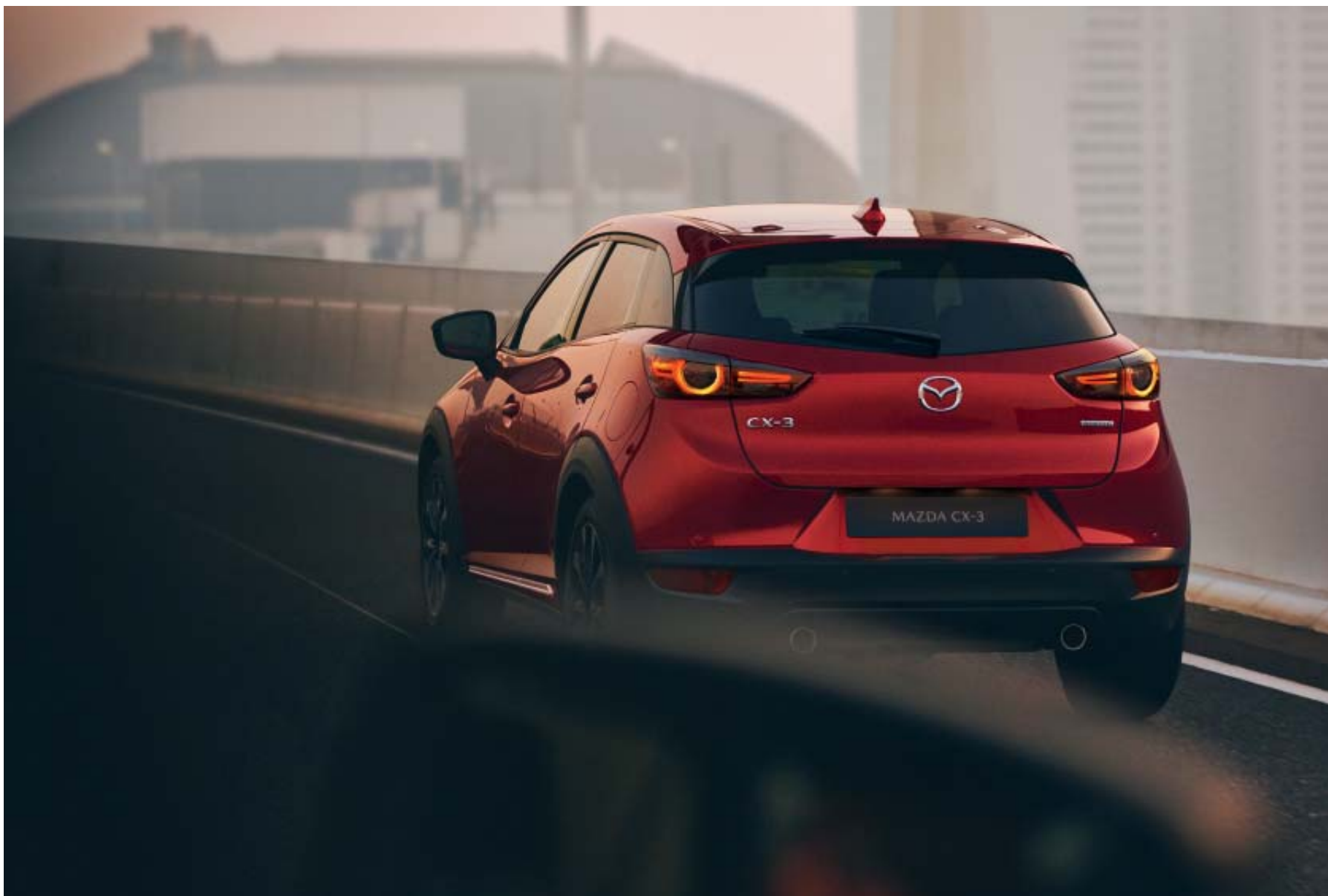
Foto: Mazda CX-3 in Soul Red Crystal Metallic