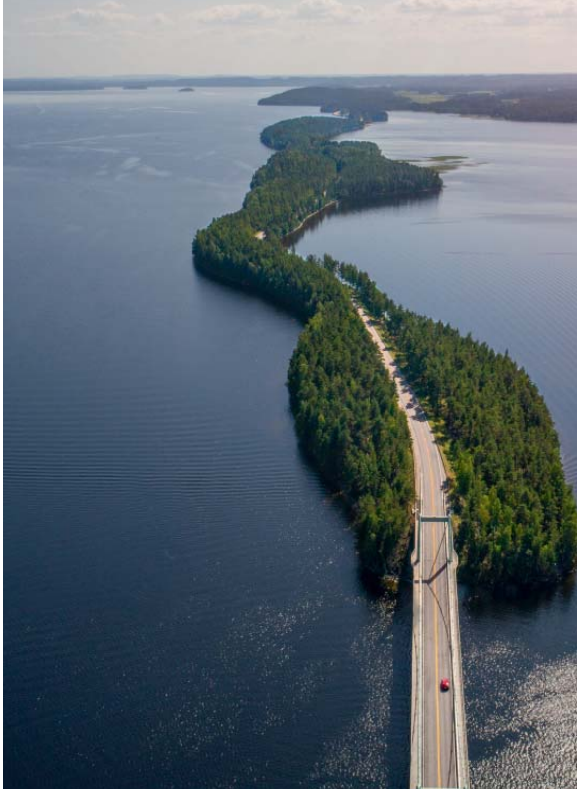
Foto: Mazda CX-3 in Soul Red Crystal Metallic