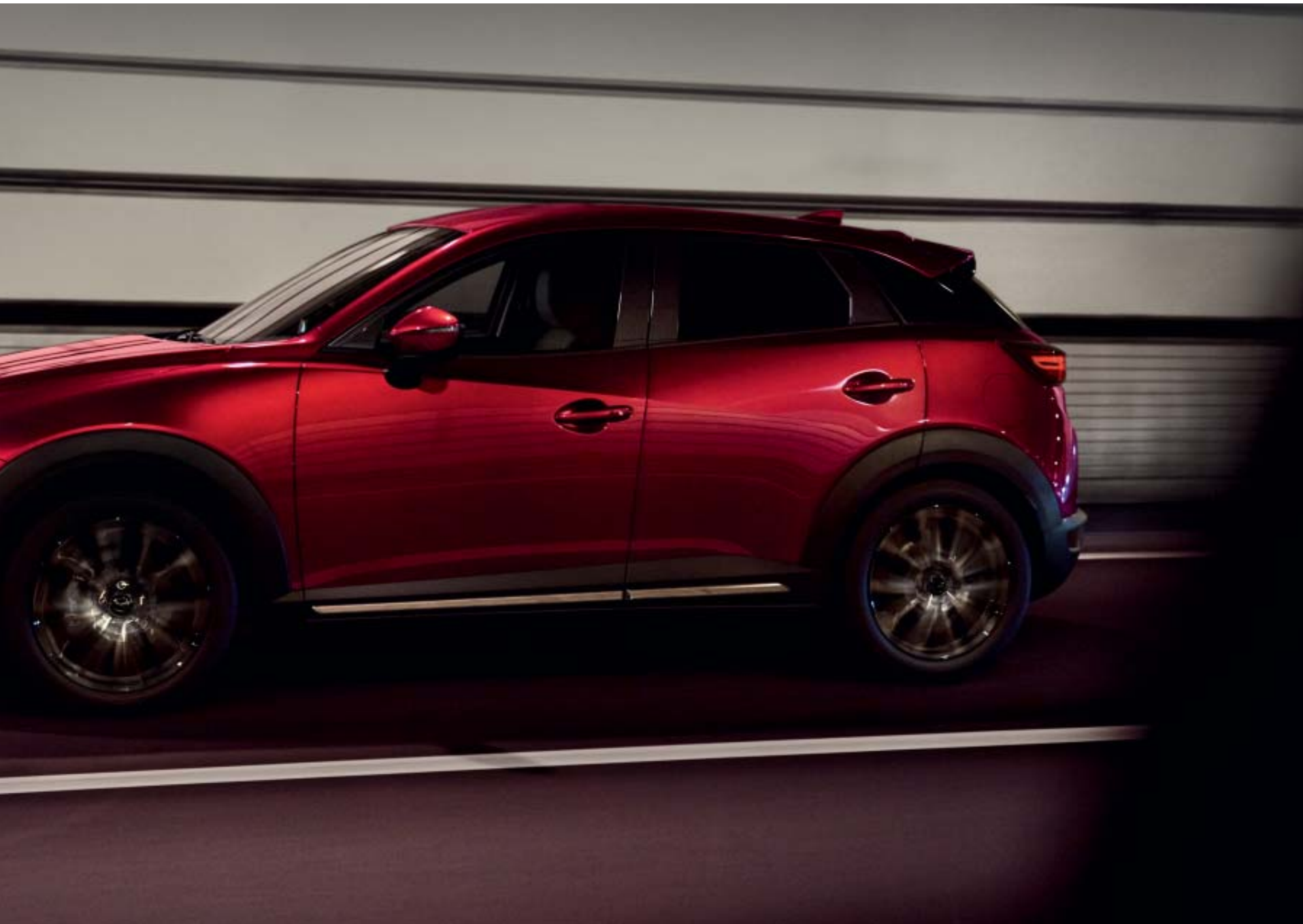
Foto: Mazda CX-3 als Signature uitvoering in Soul Red Crystal Metallic