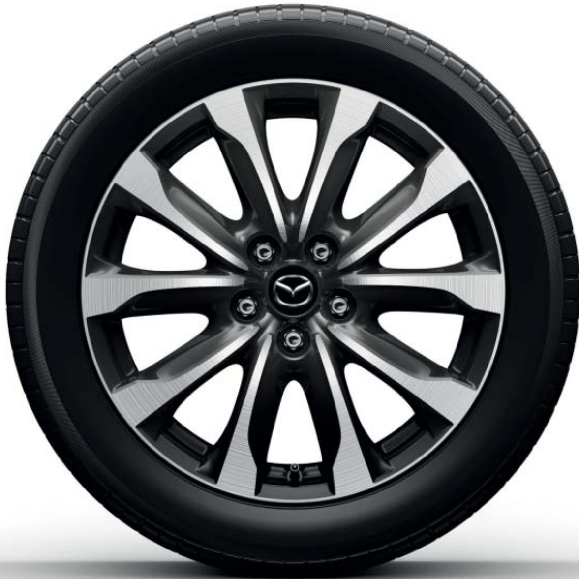
18-inch lichtmetalen velg in Gun Metal (standaard op de Mazda CX-3 als Luxury uitvoering)