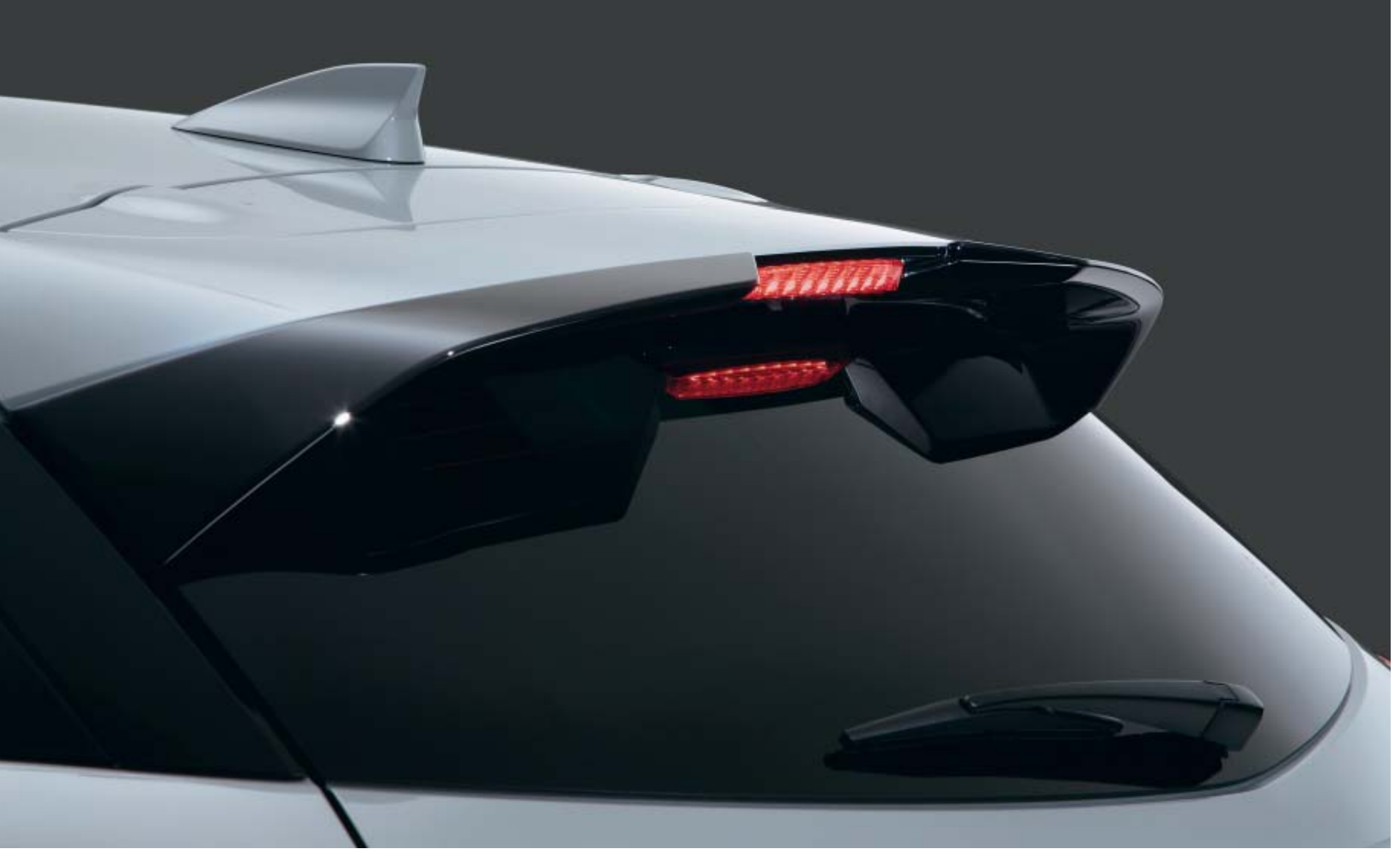
Dakspoiler in zwart