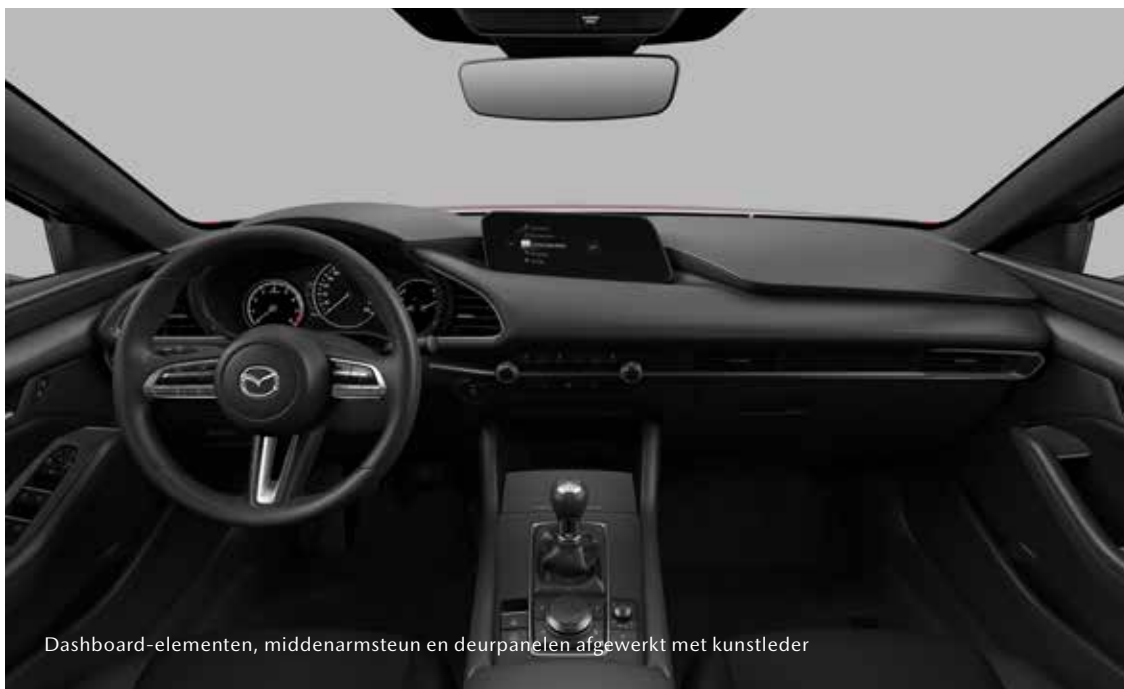
Dashboard-elementen, middenarmsteun en deurpanelen afgewerkt met kunstleder