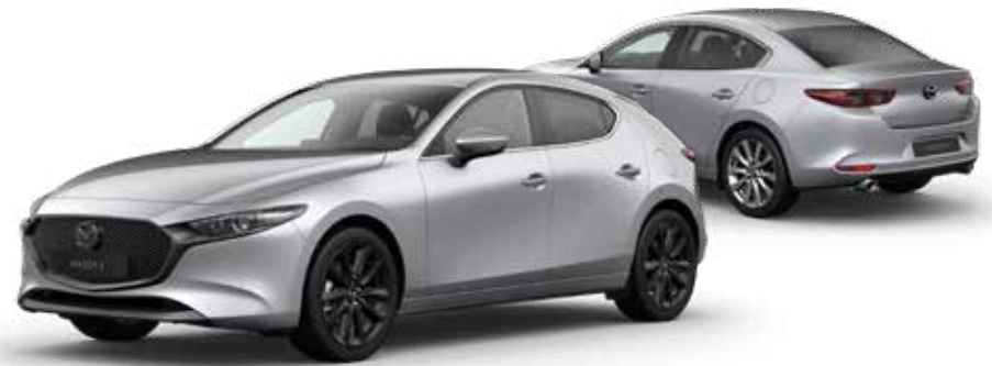
SONIC SILVER METALLIC € 800