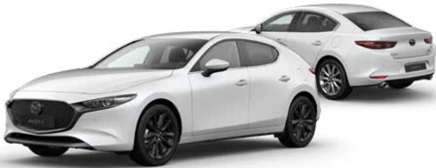
SNOWFLAKE WHITE PEARL € 800