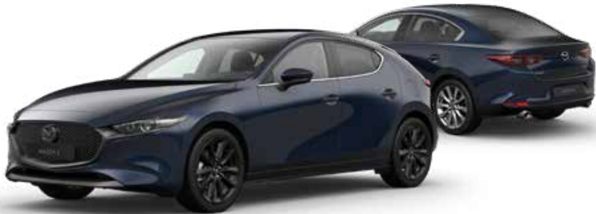
DEEP CRYSTAL BLUE MICA € 800