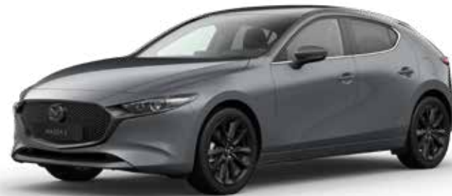
POLYMETAL GRAY METALLIC (enkel beschikbaar op Hatchback) € 800