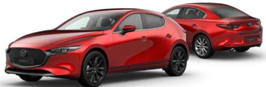
SOUL RED CRYSTAL METALLIC € 1.150