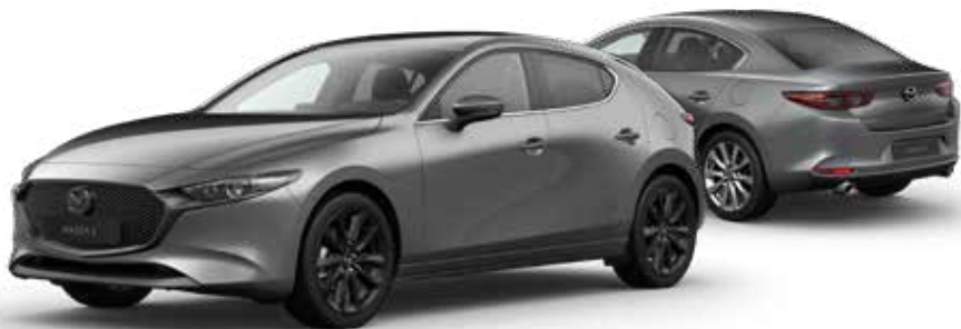
MACHINE GRAY METALLIC € 1.000