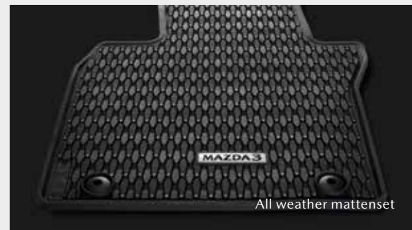
All weather mattenset