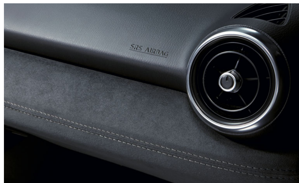
Deurpanelen, dashboard, versnellingspook en handremhoes van Alcantara®