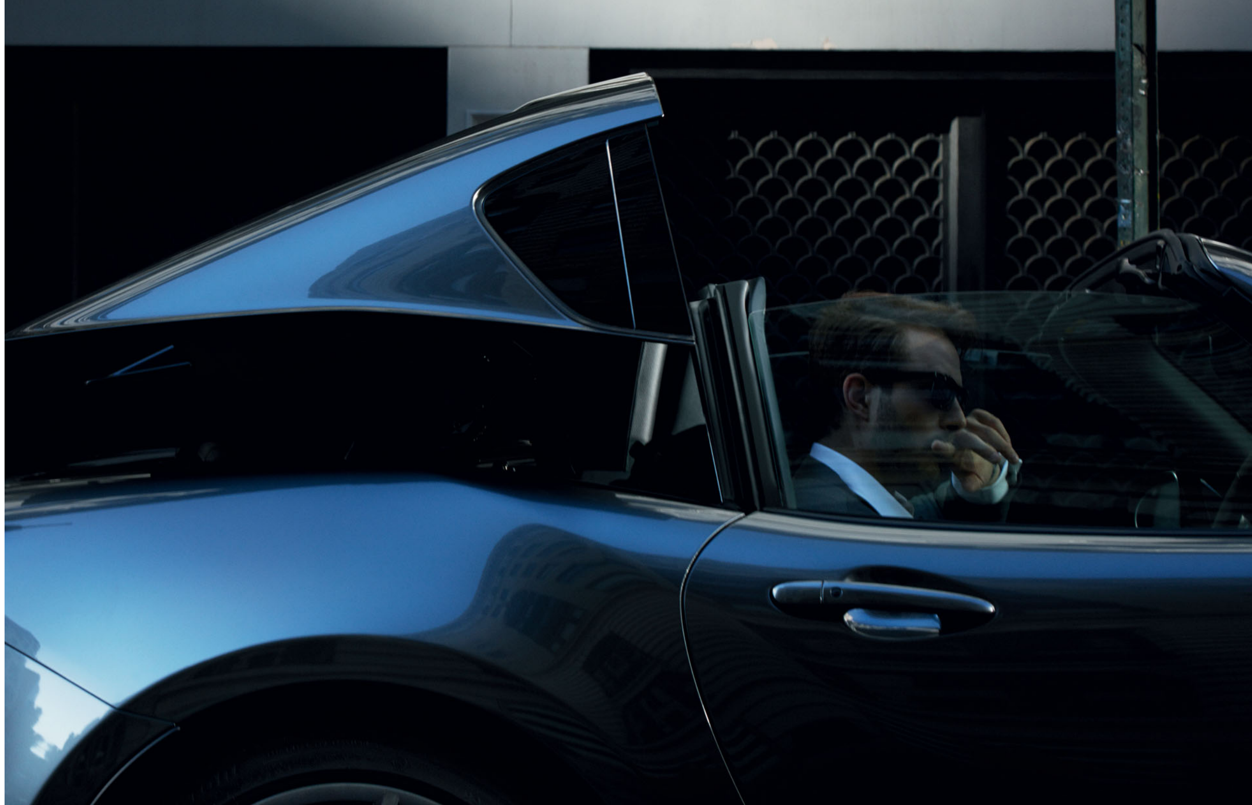
Foto: Mazda MX-5 RF als Luxury uitvoering in Machine Gray

Hoe beter je de Mazda MX-5 bekijkt, hoe intrigerender het wordt. In elk detail van de Mazda MX-5 zie je de Kodo designfilosofie van Mazda terug. Van de lichtmetalen velgen tot de afwerking van de raamlijst en spiegels. Voldoende mogelijkheden om aan te sluiten op je persoonlijke voorkeuren met de beschikbare originele accessoires. Zo wordt de band tussen jou en je auto nog sterker.