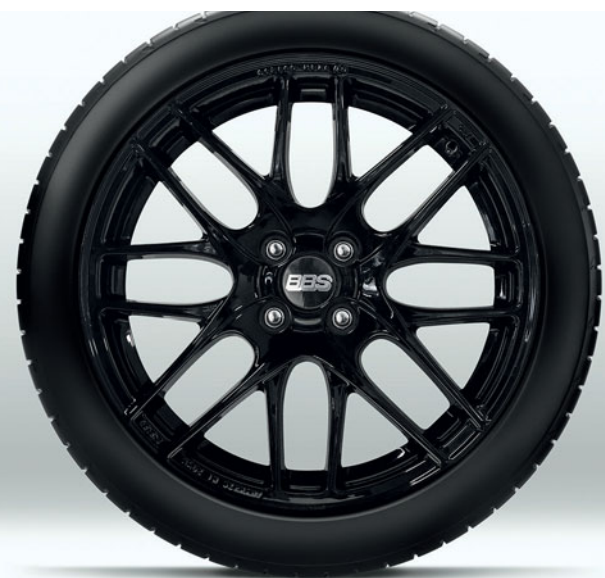
17-inch lichtmetalen BBS forged velgen in Black (beschikbaar als accessoire, standaard op de Signature uitvoering met Skyactiv-G 184)

Met veel zorg heeft Mazda originele accessoires ontworpen die perfect bij jouw Mazda MX-5 passen. Ga voor een volledige lijst met originele Mazda accessoires voor de Mazda MX-5 naar onze website.