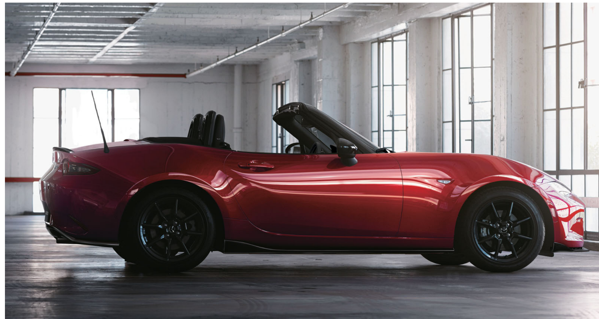
Sport pakket (spoiler voor- en achterbumper, zijskirts en sportuitlaat) in Black 17-inch lichtmetalen velgen in Black Metallic, standaard of beschikbaar als accessoire