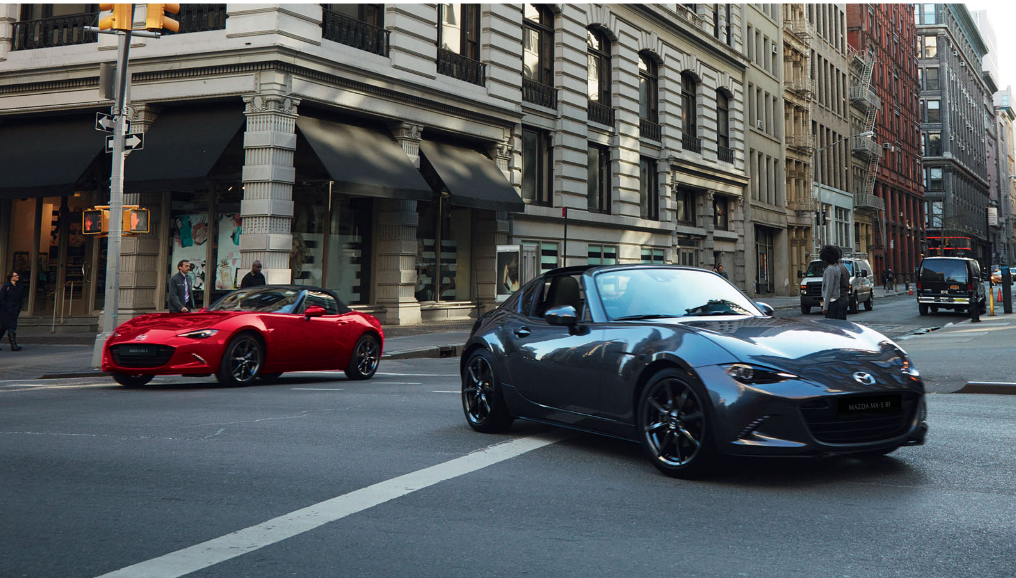
Foto: Mazda MX-5 RF als Luxury uitvoering in Machine Gray Mazda MX-5 Roadster als Luxury uitvoering in Soul Red Crystal