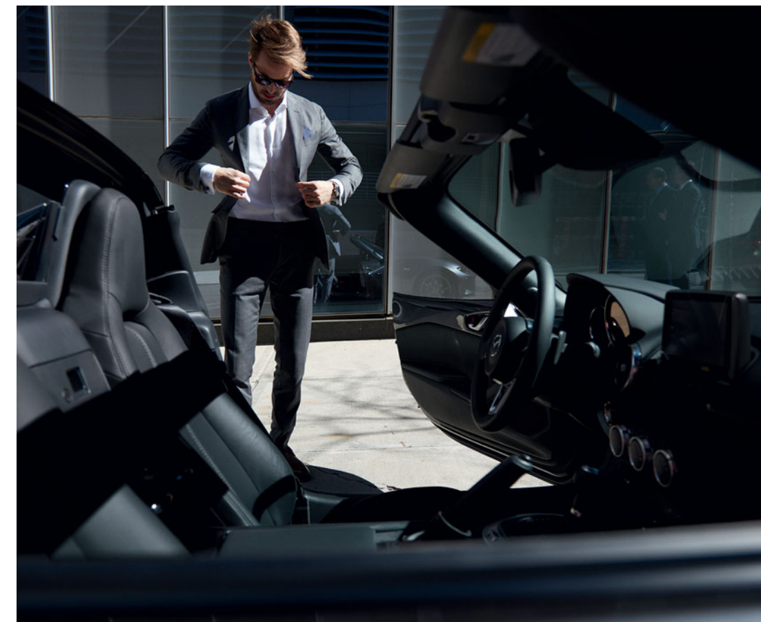
Foto: Mazda MX-5 RF als Luxury uitvoering in Machine Gray