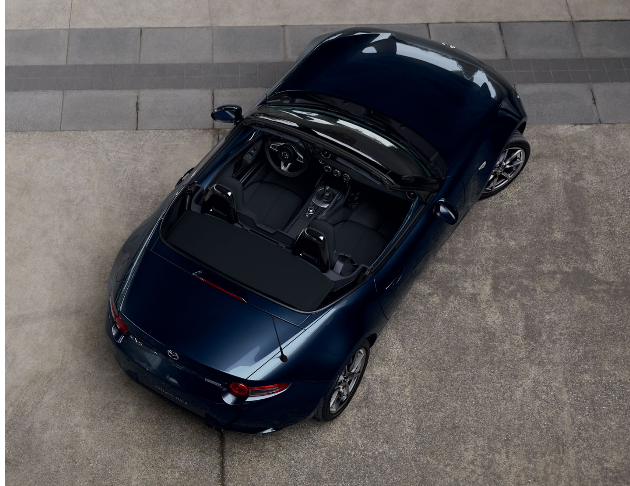
Foto: Mazda MX-5 RF als Luxury uitvoering in Deep Crystal Blue

Mazda Motor Nederland heeft deze brochure met de grootst mogelijke zorg samengesteld, maar behoudt zich het recht voor om wijzigingen door te voeren in specificaties en uitrusting als gevolg van voortdurende productontwikkeling. Wijzigingen in constructie, uitrusting en/of mogelijkheden, alsmede drukfouten zijn voorbehouden. De in deze brochure afgebeelde kleuren en voorbeelden van interieurbekleding kunnen afwijken van de werkelijke kleuren als gevolg van beperkingen in het drukprocedé. Raadpleeg altijd uw Mazda-dealer over de door hem aangeboden uitvoering, over de laatste gegevens en de aanpassings- en uitbreidingsmogelijkheden daarvan. Mazda Motor Nederland is op geen enkele wijze aansprakelijk voor mogelijke gevolgen van onjuistheden of onvolkomenheden van de inhoud van deze brochure. Het Bluetooth® woordmerk en logo's zijn eigendom van Bluetooth SIG, Inc. en elk gebruik ervan door Mazda Motor Company is met toestemming van dit bedrijf. Andere handelsmerken en merknamen zijn het eigendom van hun respectievelijke eigenaren.