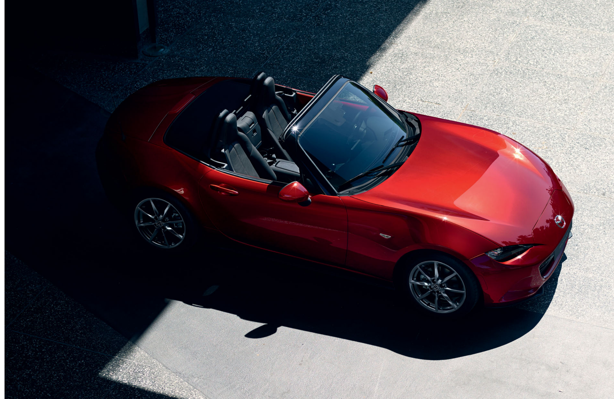
Foto: Mazda MX-5 Roadster als Luxury uitvoering in Soul Red Crystal