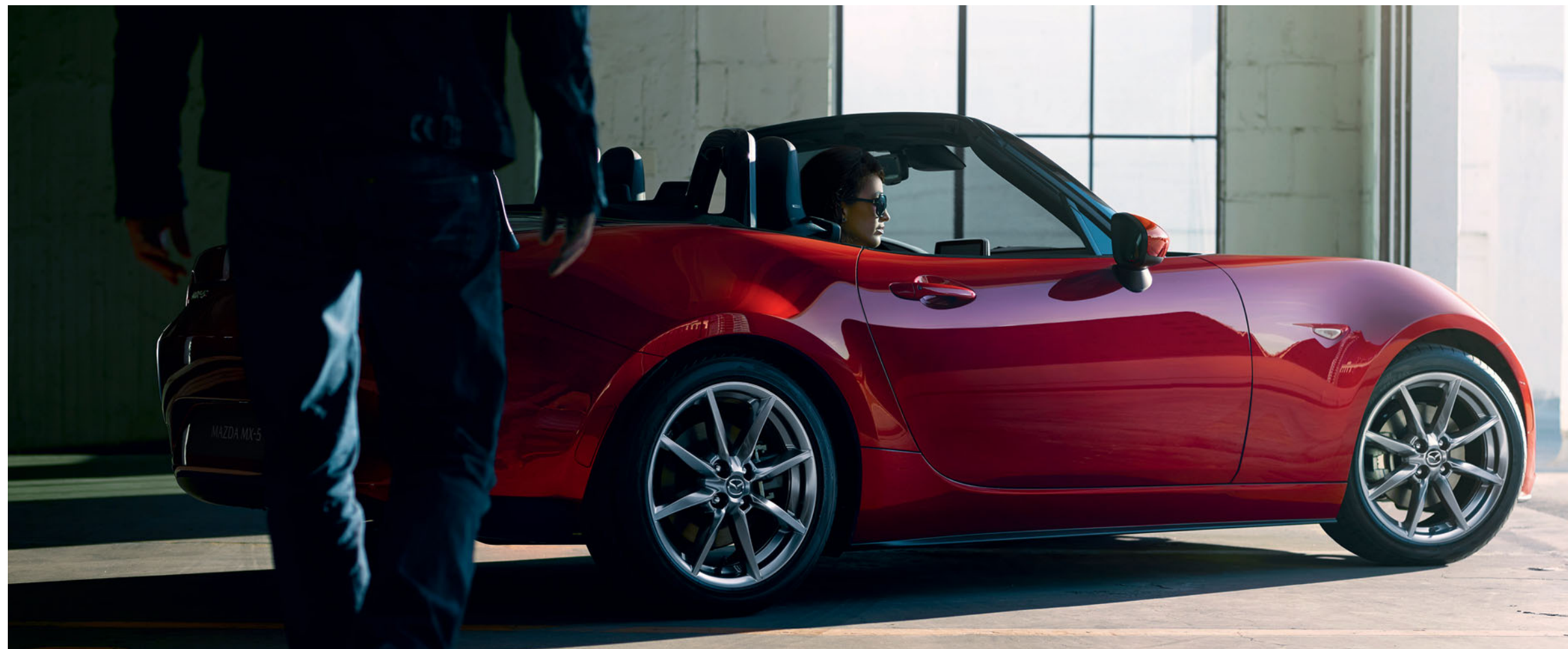
Foto: Mazda MX-5 Roadster als Luxury uitvoering in Soul Red Crystal

De Mazda MX-5 laat je hart al sneller kloppen als je er simpelweg naar kijkt. Laag en slank, met de vloeiende lijnen en contouren van het Kodo-design, lijkt de roadster al te bewegen terwijl hij stilstaat. De welvingen in de carrosserie bij de voorwielen en de juiste accenten op de achterwielen waar de kracht vandaan komt. Ook het interieur streelt al je zintuigen. Door de kleur van de buitenkant ook binnen terug te laten komen, voel je je als bestuurder nog meer verbonden met de auto. Het zal niemand verbazen dat de MX-5 al vele designprijzen heeft gewonnen, waaronder de prestigieuze 'Red Dot Design Award'.